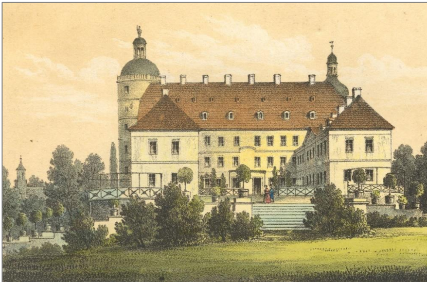
Das Schloss und die mit Orangenbäumen bestandene Rampe zu Fürst Pücklers Zeiten. Die Kübelpflanzen begleiten noch heute Deinen Weg zum Schloss.

Übrigens: Die Orangenbäume sind eine Kreuzung aus Pampelmuse und Mandarine. Ihre Früchte schmecken aber bitter, deshalb heißen sie auch Bitterorangen. Außerdem haben sie noch einen anderen Namen, den Du mit Hilfe des Rätsels herausfinden kannst.